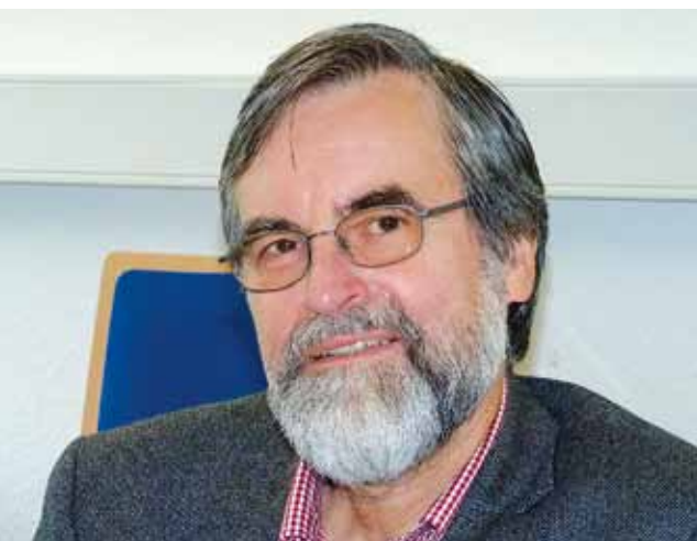
Der Justizvollzugsbeauftragte sieht sich nicht als „Feuerwehr“, die zu löschen versucht, wenn sich Störfälle ereignen.

DVD: Während Ihrer Besuche in den Vollzugseinrichtungen geben Sie den verschiedenen Gremien Gelegenheit, Missstände anzusprechen und Verbesserungsvorschläge zu unterbreiten. Wenn Sie insofern