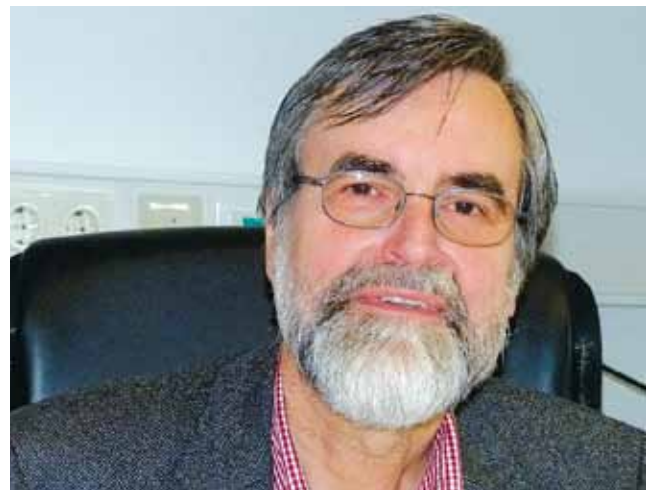
In der Verbesserung der Ausbildung sieht der Justizvollzugsbeauftragte ein lohnendes Handlungsfeld.

Es hätte freilich primär die verbindlichen Vorgaben des Bundesverfassungsgerichts umzusetzen und in diesem Sinne ein Beispiel zu geben. Dabei ist ein Verbund mit anderen Ländern, der die Vielfalt der Regelungen einschränkt, nicht ausgeschlossen. Denn der Gestaltungsfreiraum für den Gesetzgeber bleibt angesichts der verbindlichen Vorgaben