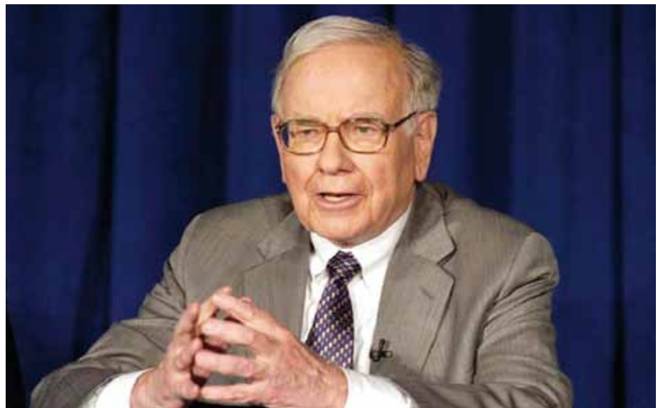
Warren Buffett zählt zu den Großinvestoren und Spekulanten, die Mitverantwortung für die Finanzkrise tragen.

Demokratie lebt von der Alternative, vom Austausch der Meinungen, vom Ringen um die beste Lösung. Derzeit aber können Politiker über das größte Problem, den Euro, gar nicht offen sprechen, weil jede Äußerung von den Märkten mit akribischer Genauigkeit re-