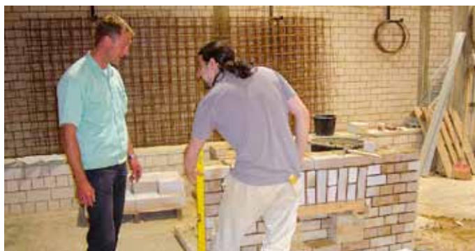
Ausbildung ist für junge Gefangene eine unverzichtbare Vorbereitung auf die Entlassung.

tere Teilprivatisierungen erwogen werden, um akut auftretenden Ausbildungsbedarf zu befriedigen. Hierzu ist festzustellen, dass bislang Einvernehmen darüber be-