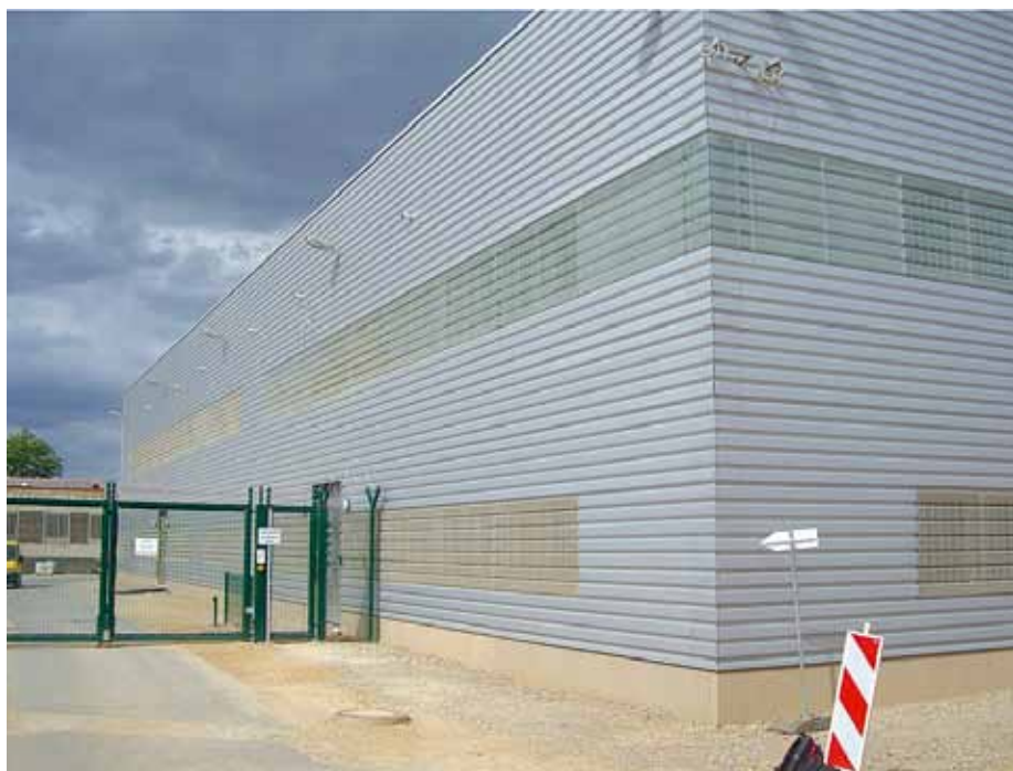
Neue Arbeitsbetriebe bei der JVA Heinsberg. Wird das Ausbildungsangebot für die Gefangenen erweitert oder verzichtet man angesichts rückläufiger Belegungszahlen auf die Ausweitung der Palette der Ausbildungsgänge?

für die Verlagerung von Personal in andere Vollzugseinrichtungen bittet. Für den BSBD ist diese Ankündigung von besonderer Bedeutung, dass im Bedarfsfall wei-