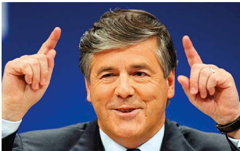
Deutsche-Bank-Chef Ackermann hat gut lachen. Mit Investmentbanking verdient er viel Geld. Läuft es schief, kann er sich auf den Steuerzahler verlassen.

D eutschland hat augenscheinlich Tritt gefasst, das Wirtschaftswachstum ist überragend, die Regierung geht von über drei Prozent für das laufende Jahr aus. Damit scheint Deutschland ganz gut durch die Krise gekommen zu sein. Doch sie ist noch nicht vorbei. Die vielen finanzwirtschaftlichen Risiken, die sich um die Rettung von Banken und ganzen Staaten ranken, trüben den Blick in die Zukunft und sie ziehen der Politik faktisch den Boden unter den Füßen weg. Die Wirtschaft ist deshalb so schnell wieder angesprungen, weil sich Deutschland während der zurückliegenden zehn Jahre zu einem Billiglohnland entwickelt hat. Zählte die Bundesrepublik Ende der 1990er Jahre noch zu den Ländern, in denen abhängig Beschäftigte gutes Geld verdienen konnten, hat sich dieses seither grundlegend gewandelt. Die Arbeitnehmer in Deutschland haben seit der Jahrtausendwende kaum ihr Realeinkommen sichern können, während in den anderen europäischen Staaten hohe Steigerungen der Löhne und Gehälter erreicht wurden. Die Gesamtentwicklung wird von den Kolleginnen und Kollegen als zutiefst ungerecht und inakzeptabel empfunden, weil Deutschland erneut die Hauptlast dieser Risiken tragen soll, wofür wir als Steuerzahler in Haftung genommen werden.