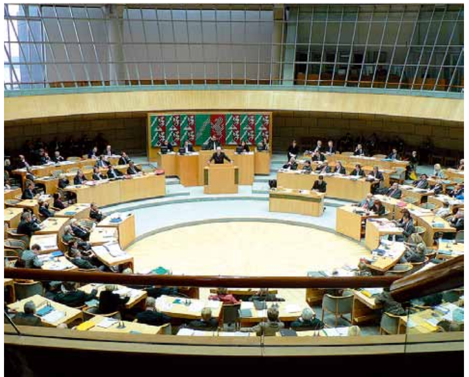
Die wesentlichen Vorschläge von BSBD und dbb nrw sind in die Gesetzesnovelle zur Modifizierung des Mitbestimmungsrechts eingeflossen.

auf, zuzustimmen und das Gesetz schnellstens zu verabschieden“. Mit dieser klaren Forderung des Beamtenbund-Chefs erwartet der dbb NRW auch die Zustimmung der früheren Schwarz-Gelben Koalition. Bei der Anhörung im Landtag hat der dbb Nordrhein-Westfalen weitere