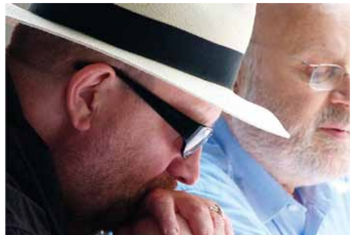
Auch die Seelsorger ließen es sich nicht nehmen, dem Fest beizuwohnen. Sie waren – wie immer – gut behütet.