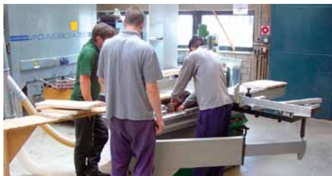
Unabhängig von den Kosten sollten Jugendstrafgefangene beruflich qualifiziert werden, wenn sie sich als ausbildungsfähig erweisen.