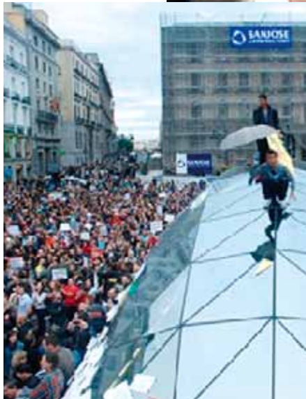
In Spanien geht die Jugend auf die Straße. Sie will nicht für Investoren arbeiten, sondern die eigene Zukunft gestalten.

selbstverständlich auch die Kolleginnen und Kollegen vor eine wichtige Grundsatzentscheidung: In welchem politischen System wollen wir künftig leben? Von der Politik, wie sie sich gegenwärtig präsentiert, haben sich viele Menschen bereits verabschiedet. Der Politik wird nicht mehr zugetraut, die Probleme der Gesellschaft an-