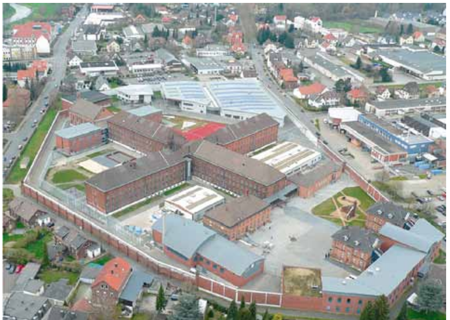
Nachdem die Arbeitslosigkeit signifikant zurückgeht, wird es deutlich schwieriger, Nachwuchskräfte für den Strafvollzug zu begeistern.

Die Bewerber für die Laufbahn des Werkdienstes werden im Hinblick auf ihre im Strafvollzug verwendbare berufliche Qualifikation eingestellt und erwerben während der Ausbildung eine weitere vollzugsspezifische Qualifizierung. Hierdurch eröffnet sich die Möglichkeit, Mitarbeiter des Werkdienstes in den Betrieben der Vollzugseinrichtungen einzusetzen, ohne zusätzliches Personal