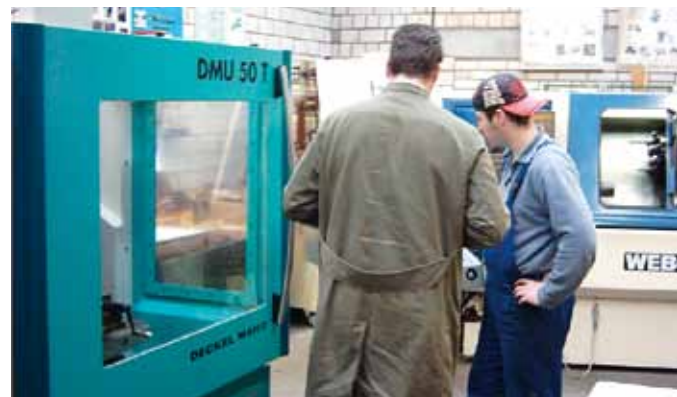
Auch im Werkdienst stößt die Nachwuchsgewinnung auf erhebliche Probleme, weil hier Bewerber gesucht werden, die in Handwerk und Industrie bereits als Meister tätig sind.

Für den Werkdienst tritt erschwerend hinzu, dass regelmäßig Nachwuchskräfte benötigt werden, die über eine