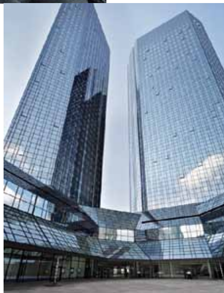
Die Deutsche Bank kam gut durch die Krise und wird in diesem Jahr 6 Mrd. Euro im Bereich Investmentbanking verdienen.

strebt für das laufende Jahr einen Gewinn von 10 Mrd. Euro an. Mit sechs Milliarden soll daran das in die Kritik geratene „Investmentbanking“ beteiligt sein. Wollen oder können wir uns bereits nach so kurzer Zeit nicht mehr daran erinnern, dass es allzu geringes Investmentbanking war, was zur Finanzkrise geführt hat? Weil sie horrende Geldsummen über den Erdball bewegen