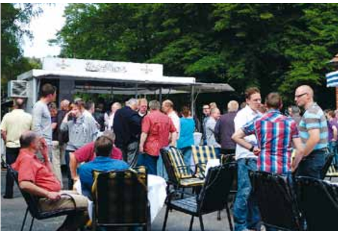
Bei sommerlichen Temperaturen sorgten kühle Getränke mit dafür, dass der Stimmungsbogen nicht riss.

Die Konzeption des Sommerfestes wurde von den Teilnehmern angenommen, so dass die Gastronomie bis in die frühen Abendstunden in Anspruch genommen wurde, bevor sich auch die Kolleginnen und Kollegen mit dem ausgeprägten Sitzfleisch in das wohlverdiente Wochenende verabschiedeten.