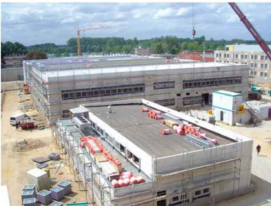
Die Bauarbeiten schreiten voran und werden voraussichtlich termingerecht abgeschlossen werden können. Darf die JVA Heinsberg dann auf eine aufgabengerechte Personalausstattung hoffen?

Daneben hat MdL Bernd Krückel (CDU) eine Kleine Anfrage an die Landesregierung gerichtet, mit der er Auskunft über die Personalausstattung der Heinsberger Vollzugseinrichtung verlangt und um die Darlegung der Gründe