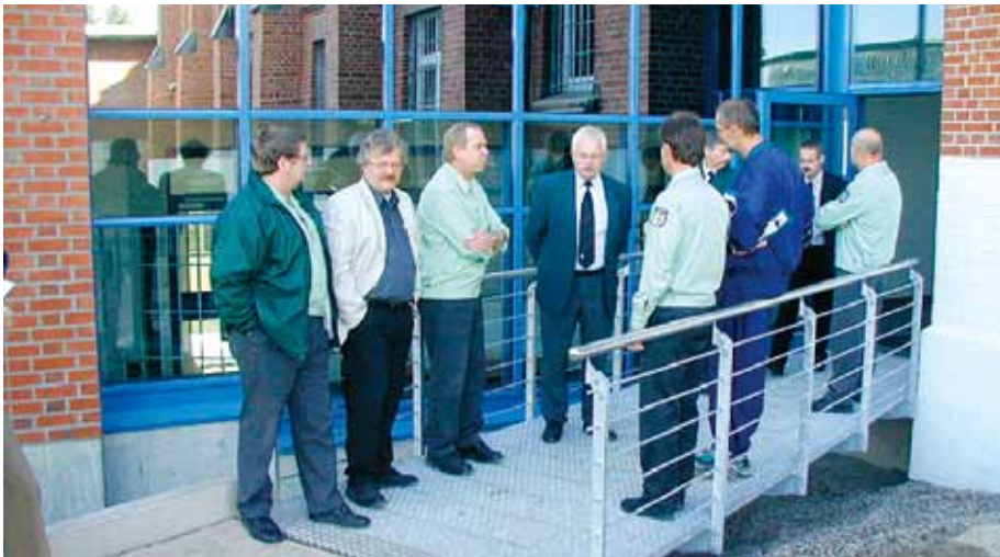
Nachdem die Arbeitslosigkeit signifikant zurückgeht, wird es deutlich schwieriger, Nachwuchskräfte für den Strafvollzug zu begeistern.

haben. Die Suspendierung des Anwärtersonderzuschlages würde in diesen Fällen dazu führen, dass Bewerber bei einem Wechsel in den Strafvollzug nicht unerhebliche Einkommenseinbußen hinnehmen müssten und als Widerrufungsbeamte im Einzelfall Gefahr liefen, Anspruch auf Sozialhilfe geltend machen zu müssen. Eine Abschreckung jener Bewerber, die sich in einem Arbeitsverhältnis befinden, wäre die zwangsläufige Folge.