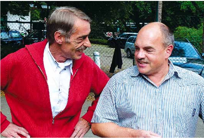
Kollegen, die sich nicht häufig im Dienst begegnen, nahmen die Möglichkeit zum entspannten Meinungsaustausch dankbar an.